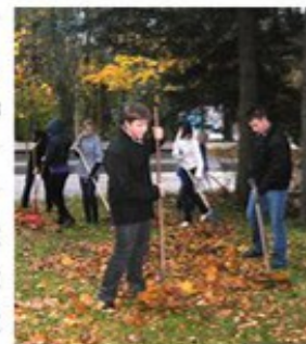
Уборка Комсомольского сквера учениками лицея №445

рают в подвижные игры на свежем воздухе. Для воспитанников лагеря проводятся экологические праздники. Например, Лесной фестиваль, о котором мы и расскажем в этом номере.